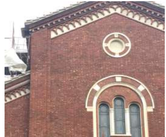
Un particolare della facciata